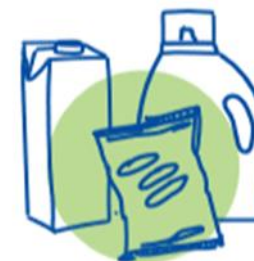
Envases y embalajes