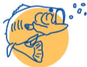
Alimentos, agua y nutrientes