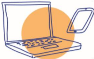
Electrónica y TIC