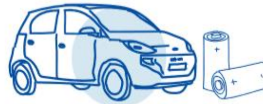
Baterías y vehículos